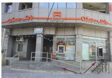
تصویر شماره‌ی (۱۲): ارتفاع زیاد دستگاه‌های خودپرداز از سطح زمین و نبود رمپ مناسب.