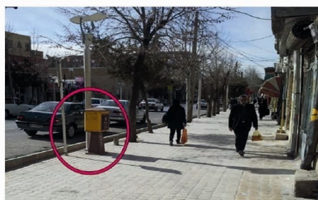
تصویر شماره‌ی (۷): موقعیت نامناسب صندوق پستی، خیابان فردوسی. منبع: نگارندگان مقاله

جدول شماره‌ی (۲): نحوه توزیع و پراکندگی صندوق‌های پستی در منطقه مورد مطالعه. منبع: نگارندگان مقاله