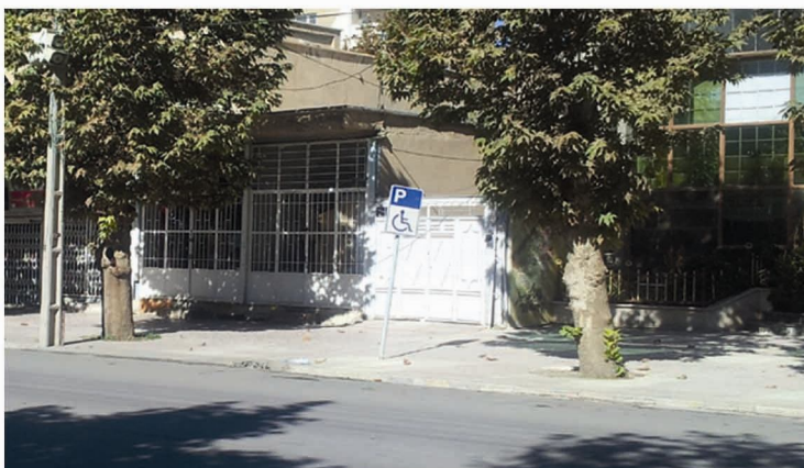
تصویر شماره‌ی (۱۵): نمونه‌ای از توقفگاه‌های ویژه‌ی معلولان، خیابان آیت‌الله حیدری.

توقفگاه اتومبیل، محل پیاده شدن سرنشینان از وسایل نقلیه و ورود آن‌ها به مسیر پیاده‌رو است. توقفگاه‌های عمومی یا توقفگاه‌های خصوصی که در کناره‌ی خیابان‌ها برای اتومبیل‌ها در نظر گرفته می‌شوند، باید تسهیلات لازم را برای سوار و پیاده شدن راننده و همراهان داشته باشند. بی‌تردید، تسهیلات لازم برای معلولینی که رانندگی می‌کنند یا اتومبیل‌هایی که سرنشینان معلول را حمل می‌نمایند، به دلیل این‌که افراد معلول هنگام سوار شدن به اتومبیل یا پیاده شدن از آن مانند افراد سالم سرعت حرکت ندارند، باید با دقت بیشتری تعبیه شوند. در خیابان آیت‌الله حیدری و خیابان فردوسی توقفگاه جهت استفاده‌ی معلولان در نظر گرفته شده است؛ ولی هیچ‌کدام استاندارد لازم را ندارند و عملاً پارکینگ ساده هستند. مهم‌ترین ایراد این توقفگاه‌ها وجود جدول و جوی آب، بین محل توقف اتومبیل و پیاده‌رو است که در تصویر شماره‌ی (۱۵) مشخص است.