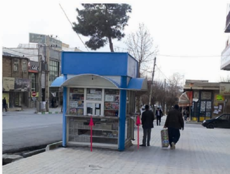
تصویر شماره‌ی (۹): ارتفاع زیاد باجه‌ی روزنامه‌فروشی، خیابان فردوسی.