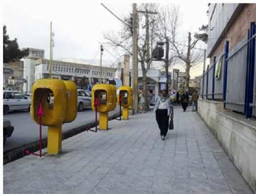
تصویر شماره ۶ (۶): جانمایی نامناسب ارتفاع زیاد دستگاه تلفن از کف باجه، میدان ۲۲ بهمن. منبع: نگارندگان مقاله

جدول شماره ۱ (۱): نحوه توزیع و پراکندگی تلفن‌های عمومی در منطقه مورد مطالعه. منبع: نگارندگان مقاله