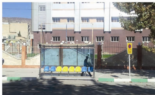
تصویر شماره‌ی (۱۰): ایستگاه اتوبوس واقع در خیابان آیت‌الله حیدری.

در هیچ کدام از ایستگاه‌های موجود در منطقه‌ی مورد مطالعه مشاهده نگردید که معلول جسمی بر روی صندلی چرخدار بتواند از اتوبوس استفاده نماید. وجود وسایل حمل و نقل عمومی قابل استفاده برای معلولان، توان آن‌ها را به اشتراک در امور اجتماعی بیشتر و از انزوایی که بدان گرفتار شده‌اند به تدریج خارج می‌کند. رعایت این مسأله، دیگر افراد جامعه را نیز نسبت به مشکلات معلولان آگاه می‌نماید. مهم ترین مشکلات معلولان در این زمینه، اول وجود اختلاف سطح بین پیاده‌رو و اتوبوس است؛ دوم عدم پیش‌بینی محل به خصوصی برای قرارگیری معلولان روی صندلی چرخدار در وسایل نقلیه عمومی است. تصویر شماره‌ی (۱۰) گویای این موضوع می‌باشد.