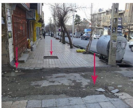
تصویر شماره‌ی (۱۴): عدم استفاده از کف‌پوش‌های مناسب، تعدد مصالح در پیاده‌روها، اختلاف سطح و موانع حرکتی