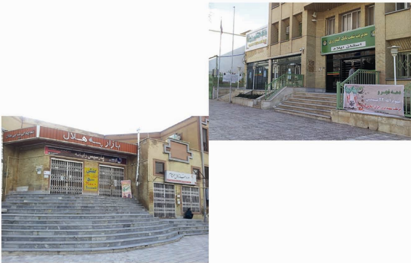
تصویر شماره‌ی (۱۱): عدم اجرای رمپ با شیب استاندارد در ورودی ادارات، بانک‌ها و ...