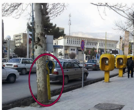
تصویر شماره ۸: نمونه‌ای از جانمایی نامناسب صندوق صدقات، میدان ۲۲ بهمن.