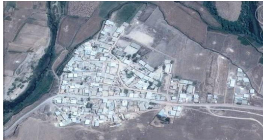
تصویر شماره (۱). بافت و موقعیت رودخانه نسبت به روستای هلسم

روستا را می‌توان متشکل از شبکه‌ی معابر و عملکردهای مختلف؛ مانند: مسکن، مدرسه و مسجد دانست که این شبکه از نظر فرهنگی و اجتماعی، بیانگر سکونت باشد. «در مناطق کوهستانی زاگرس، نحوه‌ی استقرار و بافت روستاها به لحاظ توپوگرافی؛ در سه رده: کوهستانی با شیب تند، کوهپایه‌ای با شیب متوسط و دشتی با شیب ملایم قرار می‌گیرند. بر اساس این سه رده، ساختار و بافت روستا متفاوت خواهد بود و هر یک دارای ویژگی‌های مختص خود خواهند شد» (مولانایی، ۱۳۸۴: ۱۹۶). بررسی‌ها نشان می‌دهد که روستای هلسم، با وجود اندک فضای مسطح در قسمت شمال در رده‌ی کوهپایه‌ای با شیب ملایم قرار دارد. واحدهای مسکونی در این رده، به دلیل وسعت زمین و جمعیت کم در گذشته، نسبت به نوع کوهستانی با شیب تند، در فضاهای بزرگتری طراحی و اجرا شده‌اند. در این روستا، بناها عموماً در جهت بهره‌گیری از نور و گرمای آفتاب طراحی شده‌اند. بافت روستا نیز به صورت باز و بر اساس جهت تابش آفتاب شکل گرفته است. نام‌گذاری دو محله‌ی این روستا به «خوره‌تاو» (رو به آفتاب) و «نسار» (پشت به آفتاب) بر همین اساس؛ یعنی نحوه‌ی تابش آفتاب بر بناها بوده است.