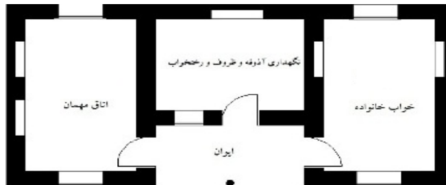
تصویر شماره (۳). پلان یک خانه ایوان‌دار در روستای هلسم

دیواخان (روبه روی هم)، به جهت تهویه ایجاد نموده‌اند و معمول است که برای بهره‌مندی از گرمای تابش آفتاب در فصل زمستان، بازشوی جنوبی قدری بزرگ‌تر از بازشو شمالی باشد. دیواخان، صرفاً کاربری پذیرایی و اکرام مهمان را دارد و هیچ استفاده دیگری از آن نمی‌شود. این فضا را به وسیله نمد، گلیم‌های خوش نقش و نگار و انواع فرش‌های دستی تزیین می‌کنند.