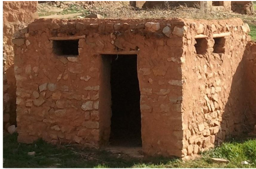
تصویر شماره (۴). نمایی از یک مطبخ در روستای هلسم

شاخ و برگ آنها پوشانده و روی آن را نیز اندود کاهگل نموده‌اند. تصویر شماره (۴) نمونه‌ای از یک مطبخ با پنجره‌هایی در جهت جنوب و غرب را ارائه می‌دهد.