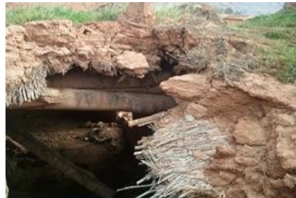
تصویر شماره (۵). نمایی از اجزای بام خانه‌ای با معماری سنتی در هلسم