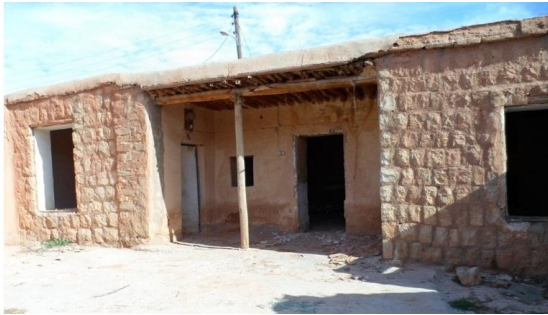
تصویر شماره (۲). بنای ایوان‌دار در حال تخریب