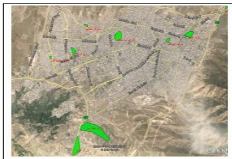
شکل شماره (۲). نقشه موقعیت پارک‌های شهر ایلام

شهر ایلام دارای ۶۱ پارک در مقیاس همسایگی و محله‌ای و ۹ پارک عمومی و فضای سبز خیابانی از جمله میدان‌ها و بلوارهای سطح شهر و تفرجگاه مرکزی پارک جنگلی چغاسبز می‌باشد (شکل شماره ۲). در مجموع، مساحت کل فضای سبز موجود در شهر، حدود ۱۶۵ هکتار برآورد شده است. در جوار شهر ایلام، سه پارک جنگلی «تنگ ارغوان»، «ششدار» و «چغاسبز» وجود دارد که با توجه به موقعیت جغرافیایی و دسترسی آسان، به صورت چشمگیری مورد استفاده ساکنان شهر قرار می‌گیرند. سرانه اکولوژیکی فضاهای سبز در شهر ایلام ۹/۷۳ متر مربع و سرانه فضای سبز تفریحی (پارک‌ها و بوستان‌ها) ۲/۱۷ متر مربع برآورد شده است (سازمان پارک‌ها و فضای سبز ایلام، ۱۳۹۳).