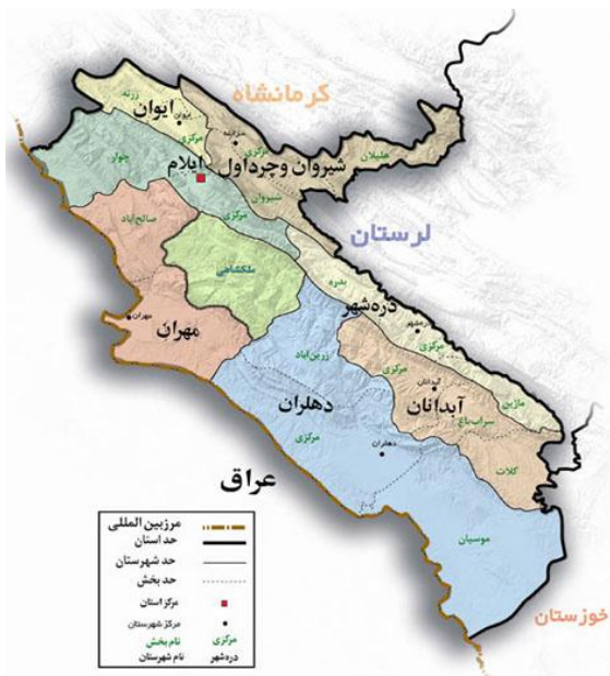
شکل شماره (۲). نقشه استان ایلام