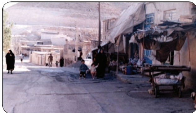
شکل شماره (۴): نمایی از حاشیه‌نشینی شهر ایلام (محلّه بان‌برز)

- حاشیه‌نشینی در شهر ایلام به سرعت در حال افزایش است (شکل شماره ۴). این مسئله منجر به توسعه‌ی شهر در شکلی ناموزون که به صورت خطی در امتداد محور شرقی - غربی می‌باشد، شده است. بخش عمده‌ای از جامعه فقیر و تهیدست به زندگی در حاشیه شهر عادت کرده‌اند و معضلات و بحران‌های این زندگی نامیومون دیر یا زود تمام شهر را فرا خواهد گرفت و به این موضوع باید به دیده یک بحران جدی نگریست.