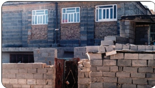
شکل شماره (۳): نمونه‌ای از ساخت و سازهای غیر مجاز در شهر ایلام (محلّه بان‌بور) مأخذ: مطالعات میدانی نگارندگان (۱۳۹۳)

- وجود پهنه‌های بلاتکلیف در اطراف شهر از دیگر مشکلات شهری ایلام می‌باشد. این پهنه‌های بلاتکلیف، زمینه‌ی توسعه‌ی غیرقانونی و ساخت و سازهای غیر مجاز را فراهم کرده است که هم اکنون و هم در آینده با تشدید بحث حاشیه‌نشینی، مدیریت شهری و مردم را با درس‌های جدی روبه‌رو می‌کند (شکل شماره ۳).