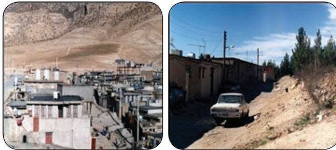
شکل شماره (۵): نمونه‌ای از بافت روستایی در شهر ایلام (محلّه بان‌بور)

- از دیگر چالش‌های شهر ایلام که مدیران شهری با آن مواجه هستند، داشتن بافت روستایی است که ساختار نامناسب و در هم و برهمی را بر سیمای شهر تحمیل نموده است (شکل شماره ۵). ایلام، شهری مهاجرپذیر است. بخش عمده‌ی جمعیت آن را مهاجران روستایی و عشایری تشکیل می‌دهد که به علت شرایط اقلیمی، امکانات نامطلوب زندگی در روستاها و مسائلی از این دست، به شهر مهاجرت کرده و در مناطق خاصی سکنا گزیده‌اند. روابط سرد، ناپایدار و بی‌ثبات اجتماعی، نامنی، تقابل گروه‌های اجتماعی و فرهنگ روستایی از عوارض این مسئله است که خدمت‌رسانی به این مناطق را نیز دشوار می‌کند.