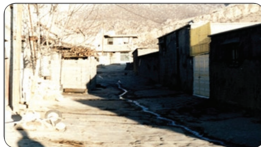
شکل شماره (۲): نمایی از بافت‌های ناهمگون و به هم ریخته در شهر ایلام (محله سبزی آباد)

– فقدان مبانی فکری و اندیشه‌ای در برنامه‌ریزی و طراحی شهر ایلام از دیگر مشکلات ملموس و قابل رؤیت می‌باشد. به تبع فقدان تفکر شهرسازانه، تقسیمات کالبدی نامطلوبی شکل گرفته است و این مسئله حاصل نوعی شهرسازی خام و ناپخته است. سیمای شهر ایلام نه به شهر باستانی و قدیمی و نه به یک شهر مدرن و جدید شباهت دارد. ساخت‌وسازهای عجولانه، عدم مطالعه و برنامه‌ریزی منسجم، عدم توجه به نظرات مشاوران و معماران، فضایی ناهمگون و غیر جذاب در این شهر ایجاد نموده و باعث اغتشاشات در منظر شهری شده است. به گفته‌ی کارشناسان، در حال حاضر، مهمترین مشکل این شهر، نداشتن طراحی مهندسی شهری و وجود بافت‌های ناهمگون و به هم ریخته است (شکل شماره ۲)؛ به گونه‌ای که تمام طراحی‌های شهری ایلام مربوط به سال‌های دور بوده و تغییر در این طراحی، نیازمند اعتبارات ویژه‌ای است. شهرداری، به دلیل ناتوانی مالی و کمبود اعتبارات، توان تأمین زیرساخت‌های شهری و سر و سامان دادن به منظر آشفته شهری ایلام را ندارد؛ از طرف دیگر توان مالی شهروندان آنقدر ضعیف است که قادر به مشارکت و نوسازی و زیباسازی منازل خود نیستند.