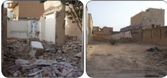
شکل شماره (۶): نمونه‌ای از بافت‌های مخروبه و فرسوده در مرکز شهر ایلام

- مسئله‌ی قابل تأمل دیگر برای شهر کوچک - متوسط ایلام که تا حد بسیار زیادی آزار دهنده و غیر معمول به نظر می‌رسد، ترافیک سنگینی است که این شهر و شهروندان با آن مواجه هستند (شکل شماره ۷). دلیل اصلی این مشکل را می‌توان تمرکز تمامی اصناف، اعم از مراکز اصلی خرید و ساختمان‌های پزشکان در مرکز اصلی شهر؛ یعنی میدان سعدی و ۲۲ بهمن دانست؛ در حالی که این دو نقطه از شهر، پارکینگ ندارند و اکثر ماشین‌ها در کنار خیابان پارک می‌شوند.