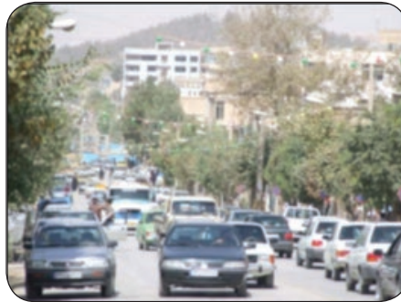
شکل شماره (۷): نمایی از ترافیک آزار دهنده شهر ایلام (خیابان فردوسی) مأخذ: مطالعات میدانی نگارندگان (۱۳۹۳)

- مسئله‌ی قابل تأمل دیگر برای شهر کوچک - متوسط ایلام که تا حد بسیار زیادی آزار دهنده و غیر معمول به نظر می‌رسد، ترافیک سنگینی است که این شهر و شهروندان با آن مواجه هستند (شکل شماره ۷). دلیل اصلی این مشکل را می‌توان تمرکز تمامی اصناف، اعم از مراکز اصلی خرید و ساختمان‌های پزشکان در مرکز اصلی شهر؛ یعنی میدان سعدی و ۲۲ بهمن دانست؛ در حالی که این دو نقطه از شهر، پارکینگ ندارند و اکثر ماشین‌ها در کنار خیابان پارک می‌شوند.