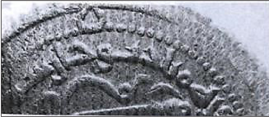
شکل (۴). سکه ابوالنجم بدربن حسنویه ضرب آریوحان (همان ۱۳۷۳: ۵۱)

به گمان وی، یکی از روستاهای نهاوند است. محمدحسن خان اعتمادالسلطنه آن را ادیوجان نوشته و یکی از روستاهای نهاوند دانسته و مسعودی در التنبیه و الاشراف شهر مذکور را به شکل اربوجان ذکر کرده است (قوچانی، ۱۳۷۳: ۵۲-۱).