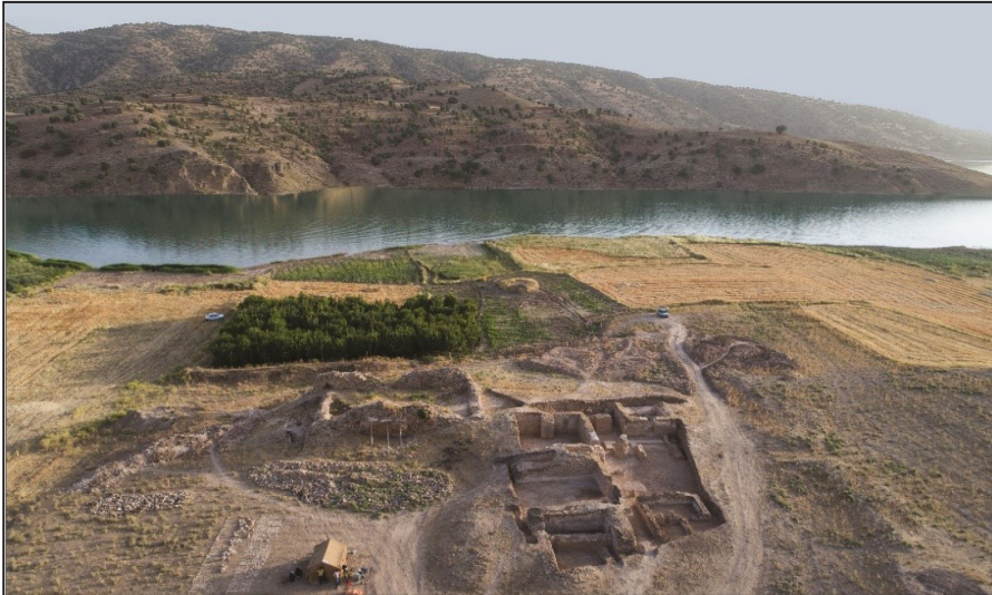
شکل (۷). نمایی از محوطه جهانگیر پس از کاوش در حاشیه حوضچه سد کنگیر (یاری، ۱۳۹۶)