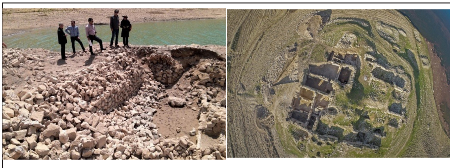
شکل (۵). نمای از بنای گوریه قبل و پس از آبیگری سد کنگیر (نگارنده، ۱۳۹۵)

باستان‌شناسان و دوستداران فرهنگ و تاریخ، اولین معترضان احداث سدهایی نظیر کنگیر بودند و در مورد غرقاب شدن سه اثر مهم تاریخی گوریه، دارساول و زیج هشدارهای جدی داده شد؛ حتی انجام عملیات حفاظت نیز تأثیری در حفظ و نگهداری آنها نداشت، زیرا در حین کار و قبل از اتمام کاوش نهایی محوطه‌ها، آبیگری سد کنگیر و بارش‌های سیل‌آسای زمستانی شروع شد و پیگیری‌های فراوان جهت جلوگیری از آبیگری نهایی سد و نجات بنای گوریه، که یک اثر مهم ثبت شده در فهرست آثار ملی نیز بود؛ همچنین توجیه مسئولان استان ایلام برای تبدیل آن به یک سایت موزه جهت جذب گردشگران در کنار دریاچه سد، مؤثر واقع نشد (خسروی، ۱۳۹۴: ۱۴).