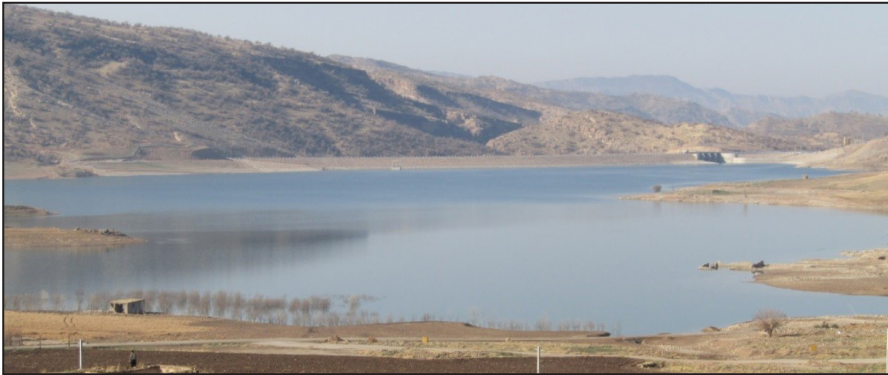
شکل (۳). نمایی از سد کنگیر پس از آبیگری (نگارنده، ۱۳۹۵)